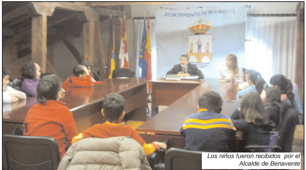
Los niños fueron recibidos por el Alcalde de Benavente