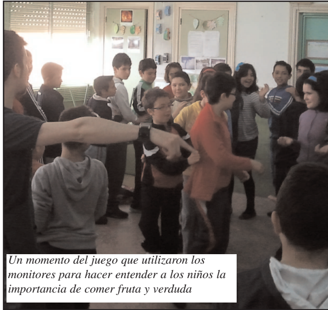
Un momento del juego que utilizaron los monitores para hacer entender a los niños la importancia de comer fruta y verdura