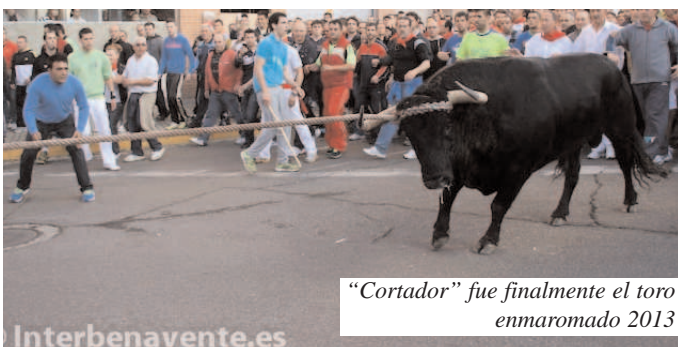
"Cortador" fue finalmente el toro enmaromado 2013

Lo más importante es que el lunes, 7 de abril, todo Benavente fue a la Plaza Mayor a pedir el toro.