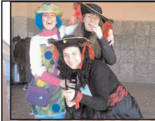
Papás y niños disfrutaron con la fiesta de carnaval

On the 8th February we celebrated Carnival at school and there were entertainer brought by the AMPA, who played games and many other things. There were music and chocolate with "churros" or sponge cake. People were disguised in different characters. It was a funny party.