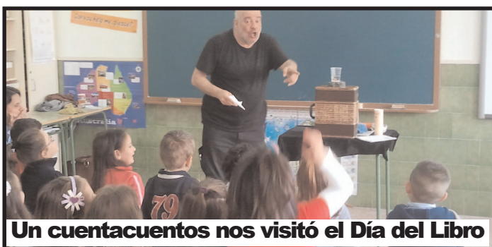
Un cuentacuentos nos visitó el Día del Libro

que debemos dar a un bien tan necesario como es el agua. También trajeron la ambulancia para conocerla por dentro.