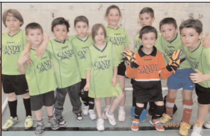
En la foto los subcampeones con su entrenador