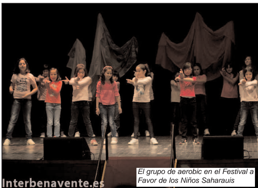
El grupo de aerobic en el Festival a Favor de los Niños Saharauis

El dinero recaudado era para los niños saharauis.