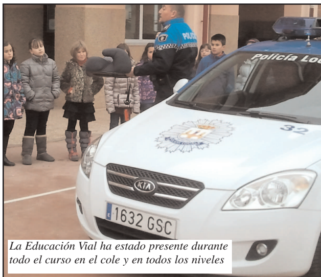
La Educación Vial ha estado presente durante todo el curso en el cole y en todos los niveles