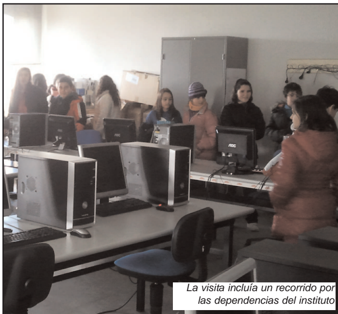
La visita incluía un recorrido por las dependencias del instituto