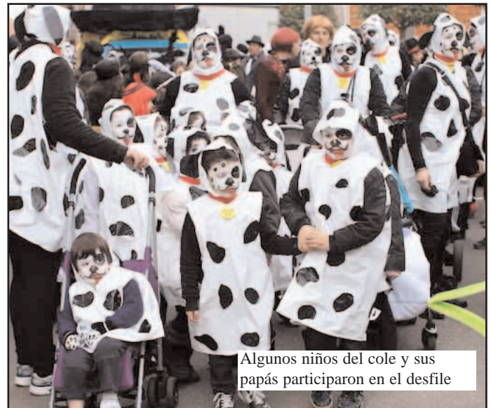
Algunos niños del cole y sus papás participaron en el desfile

El sábado, el domingo y el martes hubo baile. Y además el lunes y el martes por la mañana hubo colchonetas a la puerta del teatro.