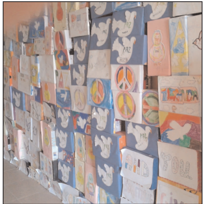
Los niños del Buenos Aires construyeron un Muro de la Paz