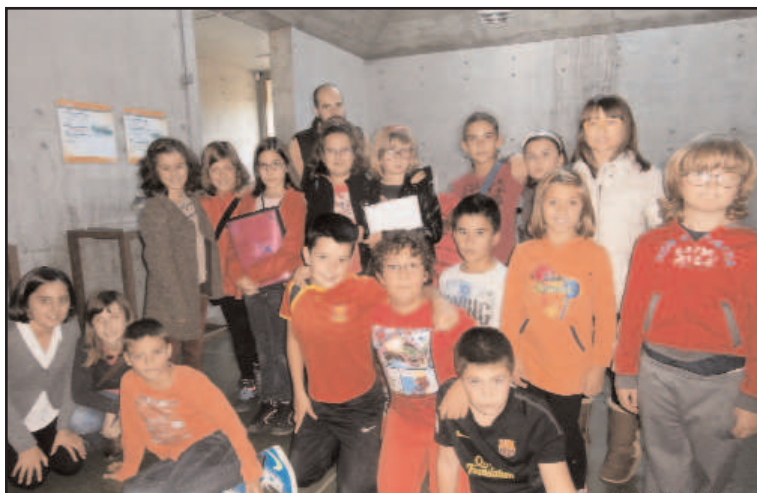
En la imagen el grupo de niños del taller que visitaron el CIT Los Ríos

La entrada al Centro de interpretación de los ríos es gratuita, por ello sería bueno que todo la gente de Benavente lo visitara, porque muchos no saben ni siquiera que es ese edificio.