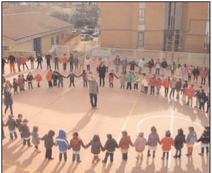
Los niños del cole se unieron en un gran corro para celebrar el Día de la Paz en el patio del cole