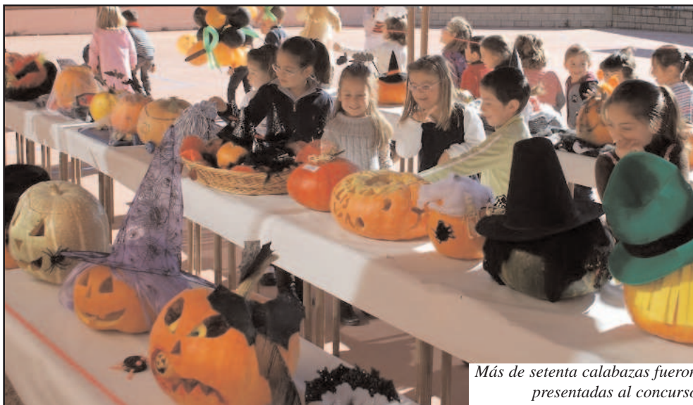
Más de setenta calabazas fueron presentadas al concurso

Por la tarde algunos niños del colegio fueron a pedir "truco o trato" y a hacer algunas bromas por la calle, otros hicieron fiestas con sus compañeros de clase y se disfrazaron.