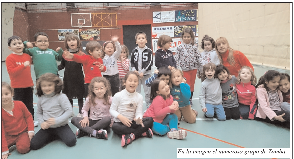
En la imagen el numeroso grupo de Zumba