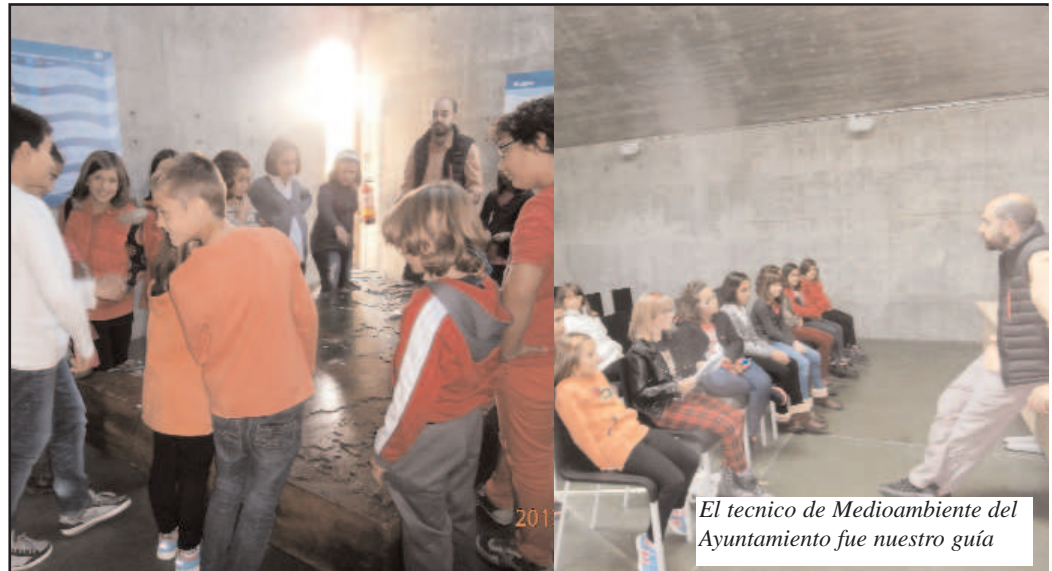
El técnico de Medioambiente del Ayuntamiento fue nuestro guía

En Benavente se ha hecho un centro de ríos porque por la comarca cruzan cinco ríos, que son el Esla, el Orbigo, el Tera, el Eria y el Cea.